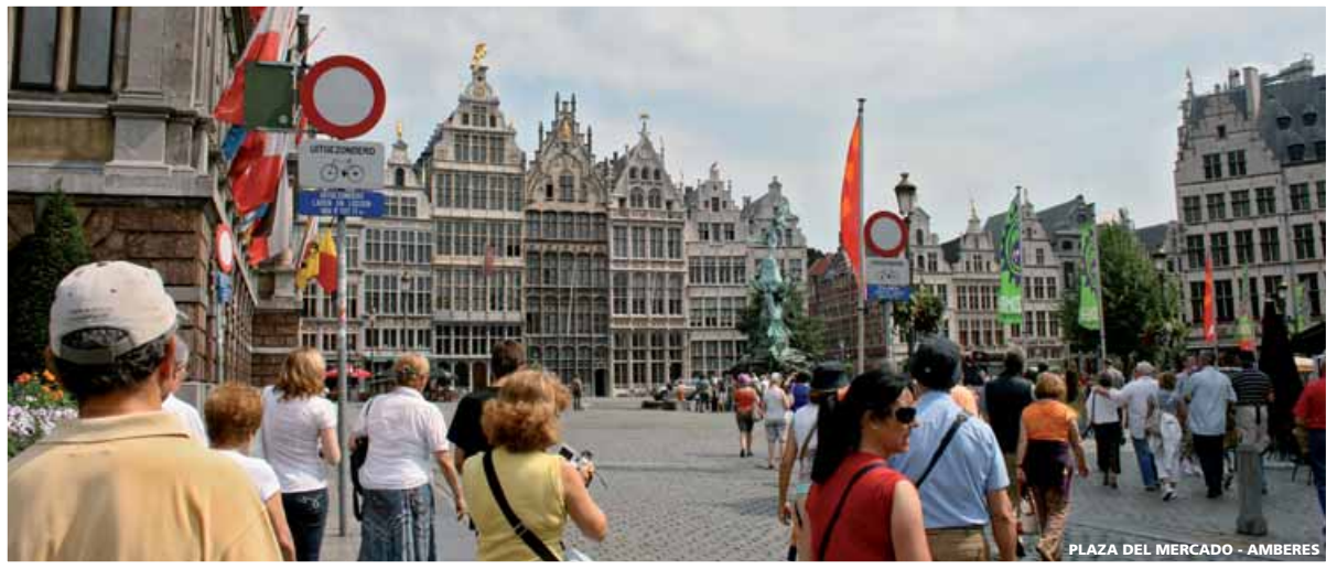
PLAZA DEL MERCADO - AMBERES