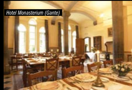
Hotel Monasterium (Gante)