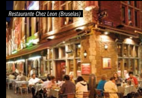
Restaurante Chez Leon (Bruselas)