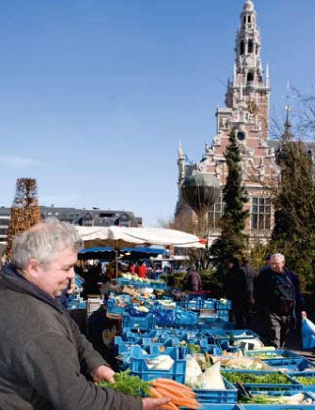
▲ Markt | Mercado - Monseigneur Ladeuzeplein