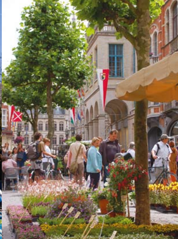
▲ Markt | Mercado - Brusselsestraat