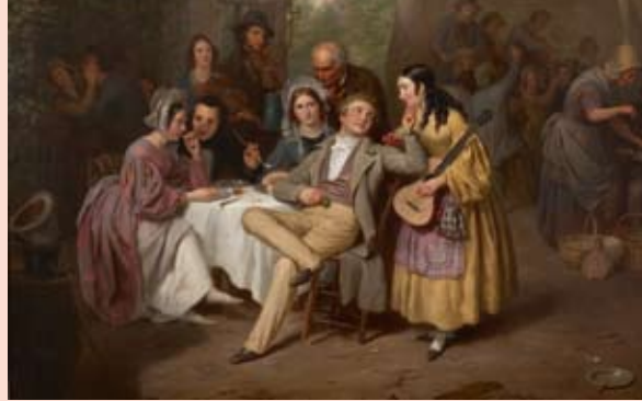
▲ Basile de Loose - Dorpsfeest

M Leuven y el Parque de la Abadía conjuntamente poseen la mayor parte de la obra conocida del artista.