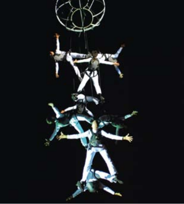
▲ Leuven in Scène