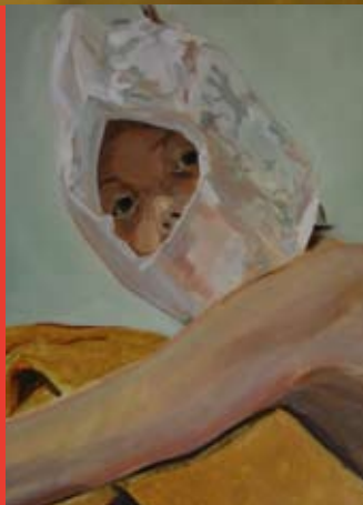
▲ Kulturama © Hilde Overbergh