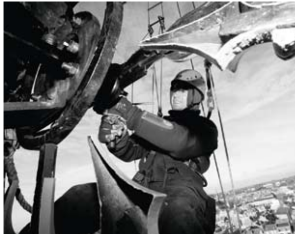
▲ Aha! WetenStappen | Senda de la Ciencia

A medida que el año llega a su fin, Flandes, y el resto del mundo, hacen sus listas: la mejor música, el político más hábil, el corredor más rápido, el mejor actor... 30CC vuelve a examinar el 2011 tres tardes de invierno. Se repasa el año que está terminando con el humor y la nostalgia necesarios y numerosos invitados famosos.