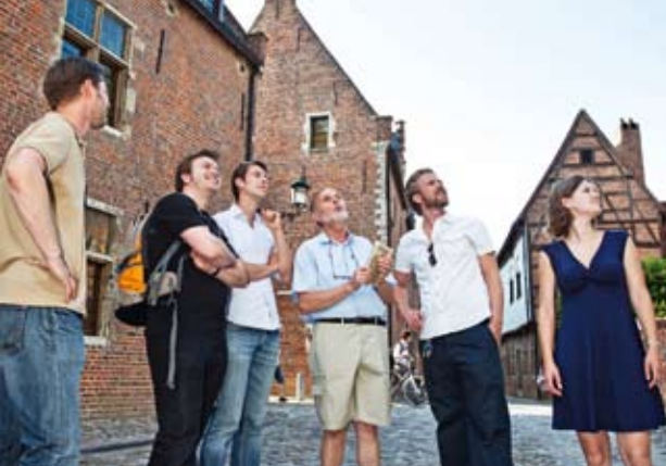
▲ Groot Begijnhof | Beaterio Grande