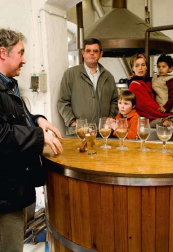
▲ Huisbrouwerij | Cervecería tradicional Domus