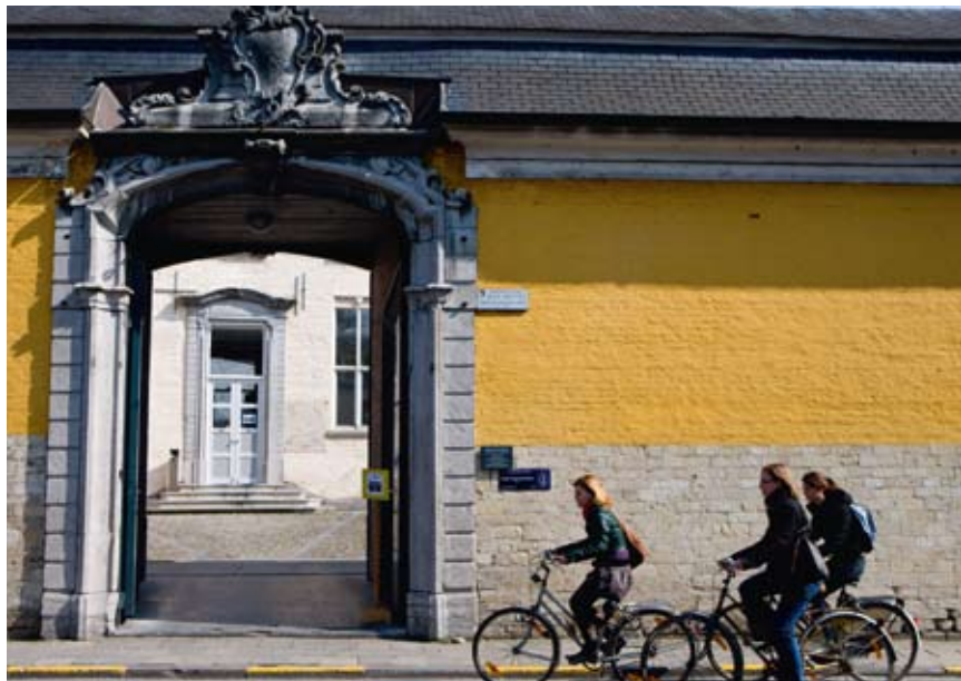
Hogenheuelcollege ► Colegio Hogenheuel

Encontrará más información sobre otras excursiones en bicicleta en www.visitleuven.be .