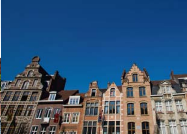
▲ Oude Markt | Plaza Antigua