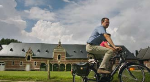
▲ Abdij van Park | Abadía del Parque