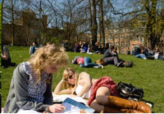
▲ Stadspark | Parque municipal

Leuven es una ciudad moderna llena de vida donde la autenticidad aún significa algo. Esto se ve bien en las diversas tiendas de calidad, tiendas de artesanía, galerías, restaurantes y cafés de la ciudad. Durante este paseo puede deambular por calles y plazas con lugares únicos que usted como visitante no encuentra así como así. Por otra parte el guía le cuenta sobre