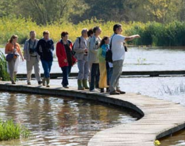
▲ Het Vinne

Los servicios de turismo de la provincia de Brabante Flamenco ofrecen una variedad de paquetes para grupos, excursiones con todo incluido, recorridos de media jornada e itinerarios cortos. Visitas a la ciudad y exposiciones, eventos temáticos culinarios e históricos, paseos en barco y programas especiales para personas con discapacidad, naturaleza y cultura... en resumen, algo para todos los gustos.