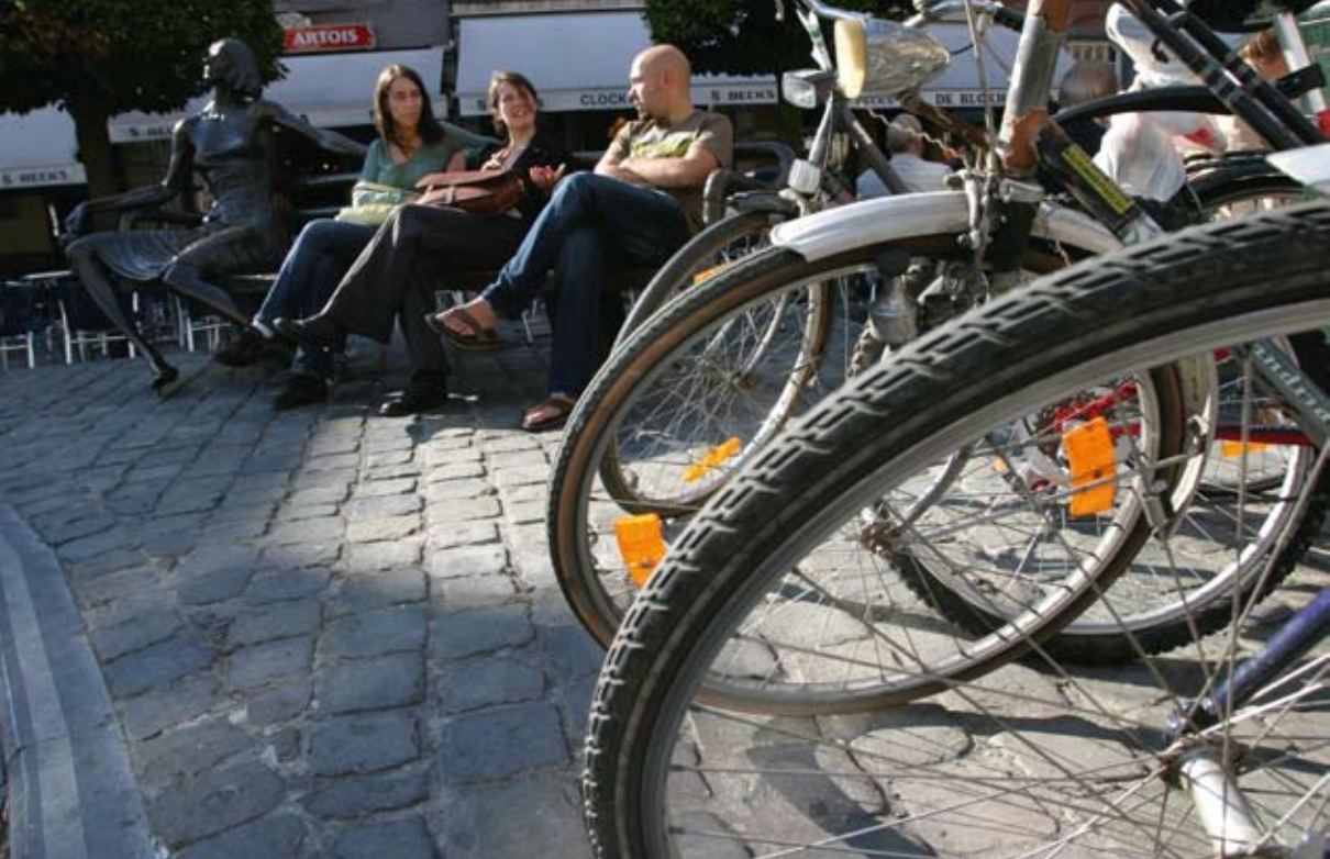
▲ Oude Markt | Plaza Antiguo