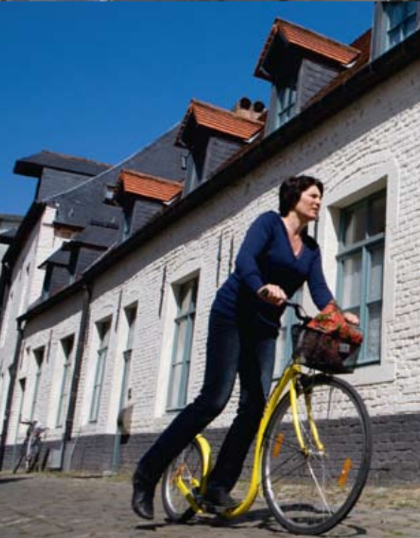
▲ Klein Begijnhof | Beaterio Pequeño

Ninguna otra ciudad flamenca resulta tan evocadora como esta antiquísima ciudad universitaria. Pasea a través de un rico patrimonio histórico. Disfruta de la jovial cultura urbana borgoñona. En colaboración con la Real Federación de Guías de Leuven (Koninklijke Leuvense Gidsenbond), Turismo de Leuven organiza visitas guiadas. Estas visitas tienen una duración media de 2 horas. Además de la oferta estándar - visitas al ayuntamiento, al Beaterio Grande y a la Iglesia de San Pedro - también ofrecemos una serie de rutas temáticas y recorridos en bicicleta. Turismo de Leuven organiza asimismo una serie de excursiones de un día, con almuerzo incluido, en las que se combina la visita guiada a la ciudad con un almuerzo. El transcurso del programa depende del tipo de excursión que elija el grupo.