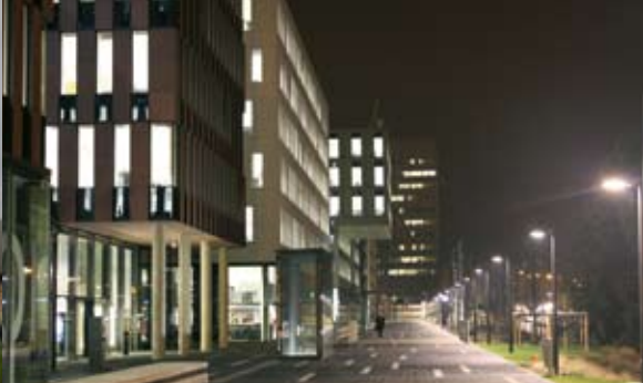
▲ Stationsomgeving | Barrio de la estación